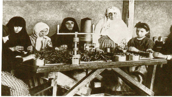
Kurtuluş Savaşı'nda mermi yapan nineler ve torunları

Başarıyı önleyecek engelleri kaldırdığın zaman başarı kendiliğinden gelir diye düşünen Atatürk, başarısızlık diye bir şey tanımazdı. Ülkenin üzerine kara bulutların çöktüğü, herkesin umutsuzluğa düştüğü işgal yıllarında bile o, umutsuzluğa düşmeyerek Kurtuluş Savaşı'nı başlatma cesaretini göstermişti. Üstelik zaferi mutlak (kesin) görmüştü.