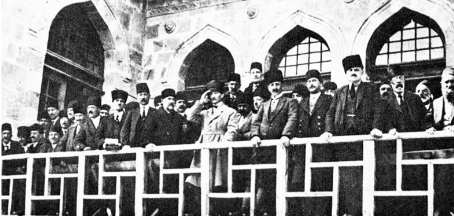
Atatürk, Meclis balkonunda, arkadaşları ve milletvekilleriyle birlikte

Kurtuluş Savaşı başladığı sırada Atatürk'e dediler ki: