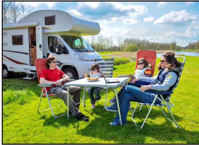
Karavanla istenen yerde kamp yapılabilir.

Tahmin edebileceğiniz gibi karavanlarda ocak, buzdolabı, ısıtıcı gibi elektrikle çalışan aygıtların yanında; oturmak ve uyumak için gereken eşyalar, su tankı, tuvalet ve banyo da bulunur. Su tankları uygun yerlerde doldurulabilir. Peki, elektronik aygıtları kullanabilmek için gereken elektrik enerjisi nereden sağlanır? Bunun için güneş enerjisinden elektrik üreten güneş panellerinden ya da jeneratörlerden yararlanılır.