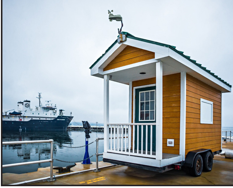
Çok küçük ev (tiny house)

Siz yaşamınızı taşınabilir bir evde geçirmek ister miydiniz?