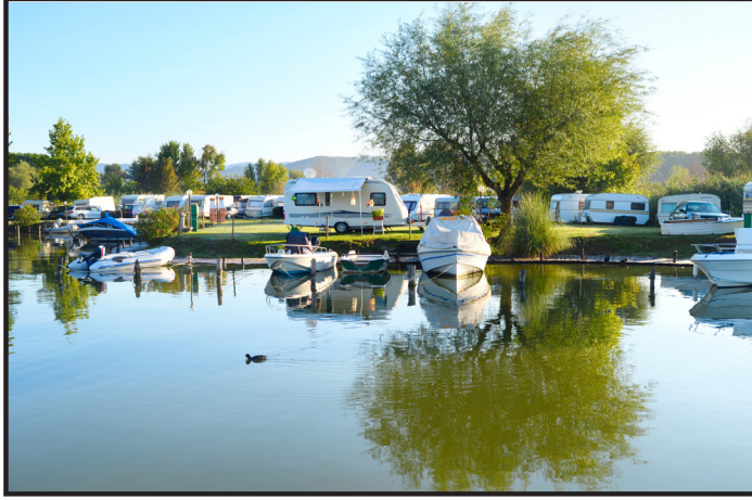
Karavan kamplarında gereksinimler giderilir.

Karavanla bir yerden istediğiniz başka bir yere gidip orada konaklamanız mümkündür. Ayrıca pek çok yerde hem güvenli hem de elektrik ve su gibi gereksinimlerinizi karşılayabileceğiniz karavan kampları bulunur. Bu kamplarda konaklayanlar kamptaki elektrik, su ve diğer hizmetlerden belirli bir ücret karşılığında yararlanır.